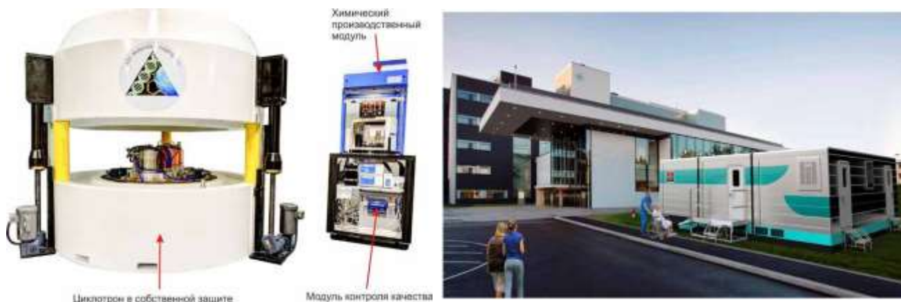
Рис. 3. Мини-циклотрон для позитронно-эмиссионной томографии «BG-75 System (Biomarker Generator)» с автоматизированным радиохимическим модулем синтеза и модулем контроля качества и передвижной модуль.

Достоинна внимания деятельность в России медицинской компании UNIX . Поскольку в настоящее время в России имеется острый недостаток стационарных циклотронов и ПЭТ центров, то развиваются нестандартные решения. Хорошим примером может служить разработка медицинской компании UNIX, с которой ЕрФИ недавно начал сотрудничать. Эта фирма разработала мобильное решение для ПЭТ, включающий Мини-циклотрон для позитронно-эмиссионной томографии «BG-75 System (Biomarker Generator)» с автоматизированным радиохимическим модулем синтеза и модулем контроля качества.