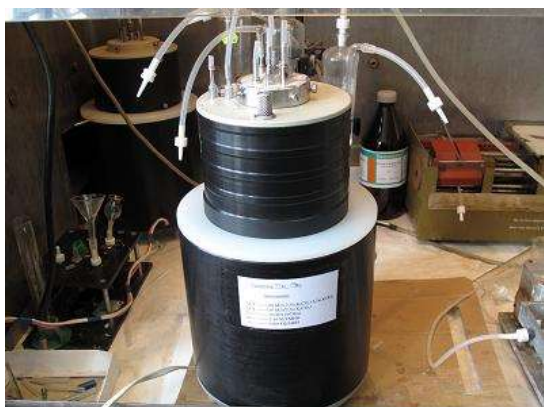
Рис. 2. Центробежный экстрактор, разработанный и изготовленный в Институте физической химии и электрохимии им. А.Н. Фрумкина Российской академии наук (ИФХЭ РАН). Автор – Александр Филянин.

Разработанный и изготовленный в этой организации центробежный экстрактор для выделения ^{90}\text{Y} из ^{90}\text{Sr} и ^{99m}\text{Tc} из ^{99}\text{Mo} обладает уникальными параметрами. В частности для варианта ^{99m}\text{Tc} достигнуто рекордно короткое время выделения 6-8 минут, выход конечного продукта составляет не менее 95%, а содержание ^{99}\text{Mo} не превышает 10^{-5}\% !