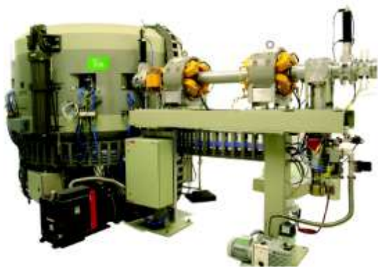
Рис. 4. Циклотрон C18 с выведенным пучкопроводом

время начнет функционировать, но и технологию изготовления мишеней для облучения, химическую технологию восстановления дорогостоящего ^{100}\text{Mo} для повторного облучения и т.д.