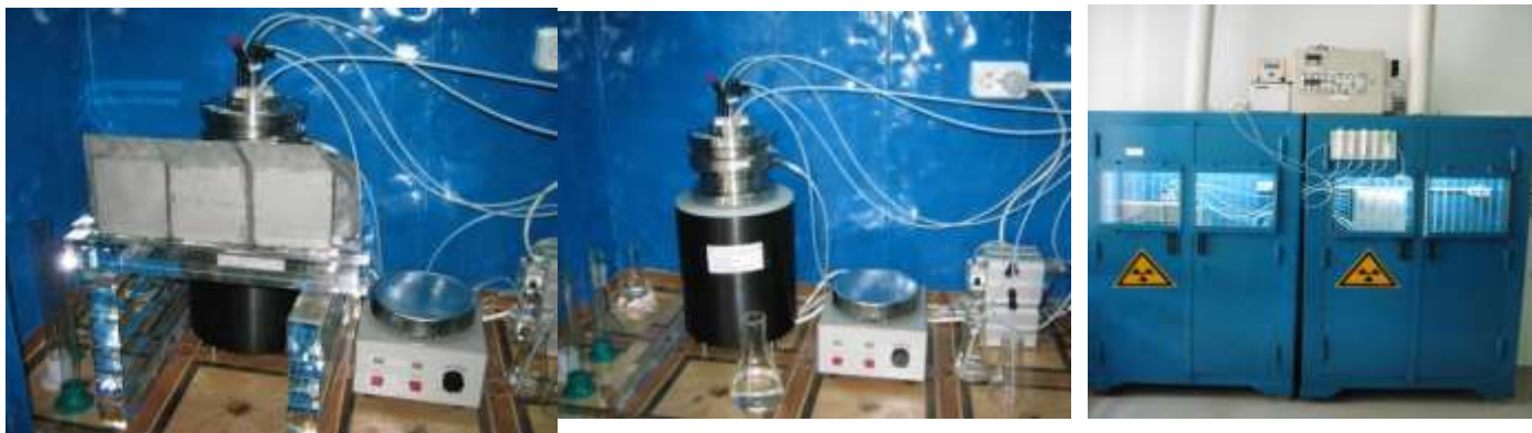
Рис. 1. Установка центробежной экстракции ^{99m}\text{Tc} из молибденовой мишени. Изготовлено в Федеральном центре по проектированию и развитию объектов ядерной медицины» ФМБА России