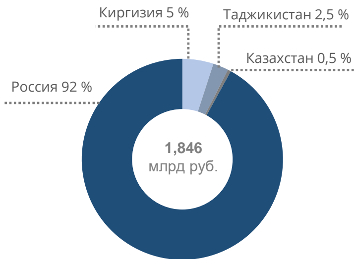
Факт на 31.12.2021