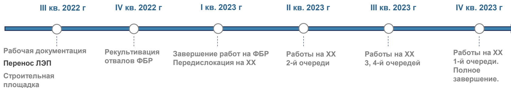
График исполнения контракта