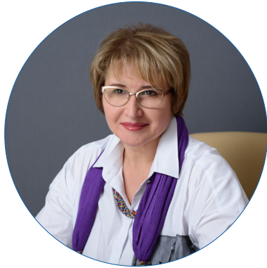
Руководитель Базовой организации, президент АО «ТВЭЛ»